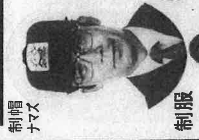
制服 ナマズ 甲借主 乙業主

社は「我が社は火災のない街づくりを目指す一翼としてその使命を担い公共の福祉に奉仕することを主義とする」 節税対策 (世界津々浦々探しても★当社より1円でも安い価格は見つかりませんよ エヘン) 全額損金 (家賃事業収入等) で落とせませよ 賢い節税対策です